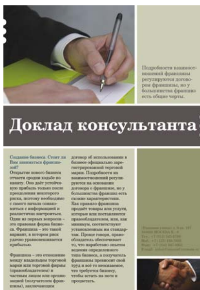
Рис. 4. Крупный заголовок контрастирует с основным текстом, а большая фотография – с маленькой. Элементы связаны между собой, но отличны друг от друга, а различие усиливает визуальную привлекательность.

Использование контраста очень важно для дифференциации элементов и их иерархической организации в пределах макета. Контрастирующие цвета, размеры, текстуры или гарнитуры шрифтов помогают создать сильный визуальный эффект и привлечь внимание к основным идеям. Элементы не должны отличаться друг от друга лишь немного: в эффективном макете они должны отличаться кардинально.