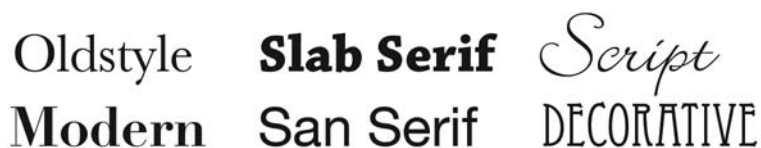
Рис. 8. Шесть категорий гарнитур шрифтов

Шрифты часто подразделяются по наличию или отсутствию засечек – небольших конечных штрихов в верхней и нижней частях линий, образующих каждую букву. Хотя гарнитур существуют тысячи (слишком много, чтобы перечислять их в данном пособии), большинство из них принадлежит к одной из шести категорий (рис. 8).