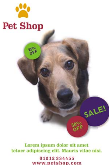
Рис. 3. Повторение визуальных элементов, таких как окружности, цвета и гарнитура шрифта, помогает объединить макет, сохраняя при этом свободу творчества.

Небольшое предупреждение, касающееся принципа повторения: будьте осторожны, чтобы не переборщить. Слишком частое повторение элемента может перегрузить страницу и затруднить понимание основной идеи. Если возникают сомнения, то лучше следовать принципу простоты.