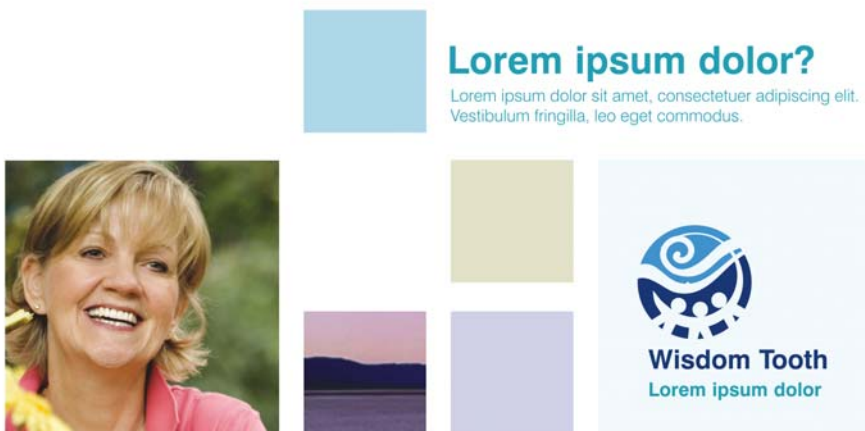
Рис. 6. Эта модульная сетка предоставляет почти безграничные возможности для создания макета, при этом ее выравнивание позволяет сохранить четкость и упорядоченность страницы