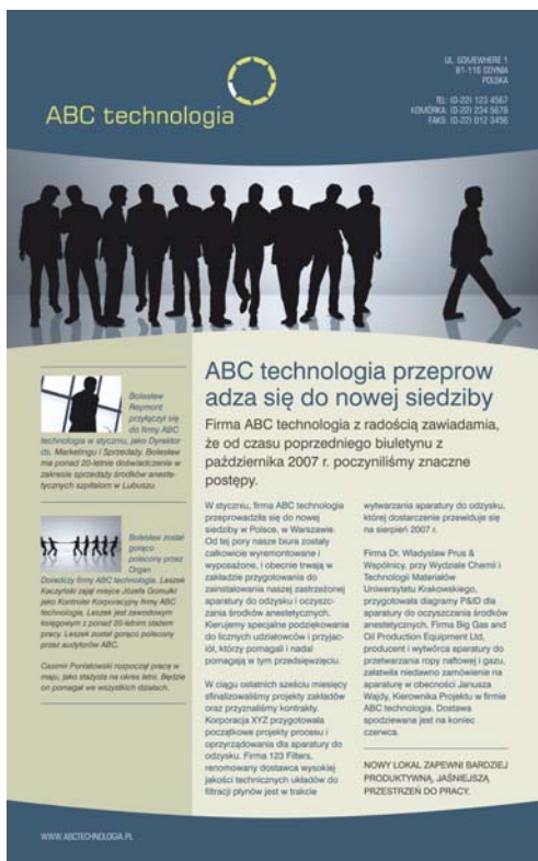
Рис. 7. Внимание читателя привлекает текст справа, имеющий более крупный заголовок и шрифт. Содержимое левого бокового столбца менее важно, поэтому текст напечатан шрифтом меньшего размера и на фоне другого цвета.

Способ расположения (упорядочивания) содержимого – центральная составляющая процесса создания макета. Для привлечения внимания читателя к наиболее важной части содержимого можно использовать размер, плотность, расположение и интервалы. Этот аспект компоновки называется иерархией макета. Примеры иерархической компоновки можно увидеть в газетах, журналах и на плакатах (рис. 7).