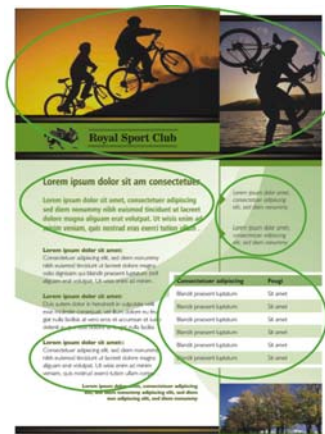
Рис. 1. Обратите внимание на группировку текста и фотографий на странице. Близость связанных между собой элементов помогает читателю ориентироваться в содержимом страницы.

Принцип близости требует, чтобы связанные между собой элементы были сгруппированы вместе, образуя единый блок. Следуя этому принципу, документ можно сделать менее беспорядочным и более