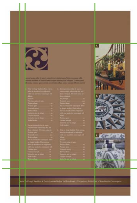
Рис. 2. Выравнивание элементов на странице придает содержимому продуманный и упорядоченный вид, указывая на то, что его стоит почитать.

Как правило, один ключевой элемент страницы действует как центральная точка, по которой выравниваются все другие элементы. Добавляя в компоновку новый элемент, выровняйте оба элемента вдоль некой невидимой линии.