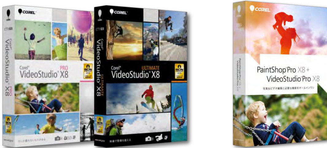
VideoStudio Pro X8 (左)、VideoStudio Ultimate X8 (中)、9/3 新発売の PaintShop Pro X8+VideoStudio Pro X8 (右) ※各アップグレード/特別優待版、アカデミック版およびダウンロード版も対象に含まれます

VideoStudio X8.5 は、ダウンロードで提供いたします。 配布方法などの詳細は、VideoStudio X8 製品ページ ( www.corel.jp/vs/ ) をご参照ください。