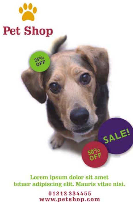
Abbildung 3: Durch die Wiederholung optischer Motive wie Kreise, Farben oder einer Schrift können Sie dazu beitragen, ein einheitliches Design vorzustellen und gleichzeitig Raum für Kreativität zu lassen.

Beherrzigen Sie an dieser Stelle jedoch auch eine Warnung bezüglich des Prinzips der Wiederholung: Übertreiben Sie nicht. Wenn Sie ein Element zu häufig wiederholen, zerstören Sie den durchdachten Aufbau der Seite und Ihre Nachricht ist nicht mehr so einfach zu verstehen. Halten Sie sich im Zweifelsfalle an die Regel: „Weniger ist mehr.“