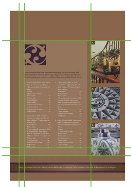
Abbildung 2: Durch geschicktes Anordnen der Elemente auf der Seite erscheint der Inhalt wohldurchdacht und strukturiert: Hier lohnt sich das Lesen.

Es lässt sich die allgemeine Regel aufstellen, dass auf einer Seite jeweils nur ein zentrales Element die Aufmerksamkeit auf sich ziehen sollte, an dem alle anderen Elemente ausgerichtet werden sollten. Wenn Sie Ihrem Layout ein neues Element hinzufügen, müssen diese beiden Elemente über eine unsichtbaren Achse aneinander ausgerichtet sein.