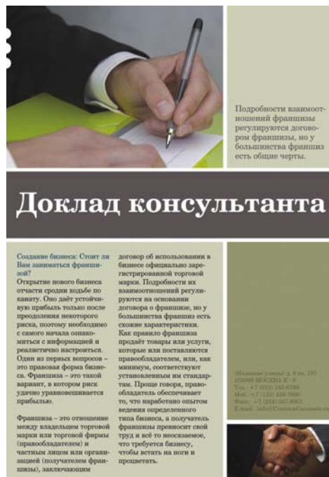
Abbildung 4: Der sehr groß gesetzte Bannertext kontrastiert mit dem Textkörper, und das große Foto stellt einen Kontrast zu dem kleinen Foto her. Zwar gehören die Elemente zueinander, sie unterscheiden sich jedoch, und dieser Unterschied allein erregt bereits visuelle Aufmerksamkeit.

Der Einsatz des Stilmittels des Kontrasts ist für die Einschätzung der Elemente und deren hierarchische Einordnung in dem Design von zentraler Bedeutung. Sie können Kontrast durch Farben, Größen, Muster und Schriften herstellen, auf diese Weise eine starke visuelle Anziehungskraft ausüben und gleichzeitig den Leser auf Ihre zentralen Aussagen aufmerksam machen. Seien Sie beim dem Herstellen von Kontrasten nicht zimperlich: Design, das seinen Zweck erreicht, stellt Elemente einander diametral entgegen.