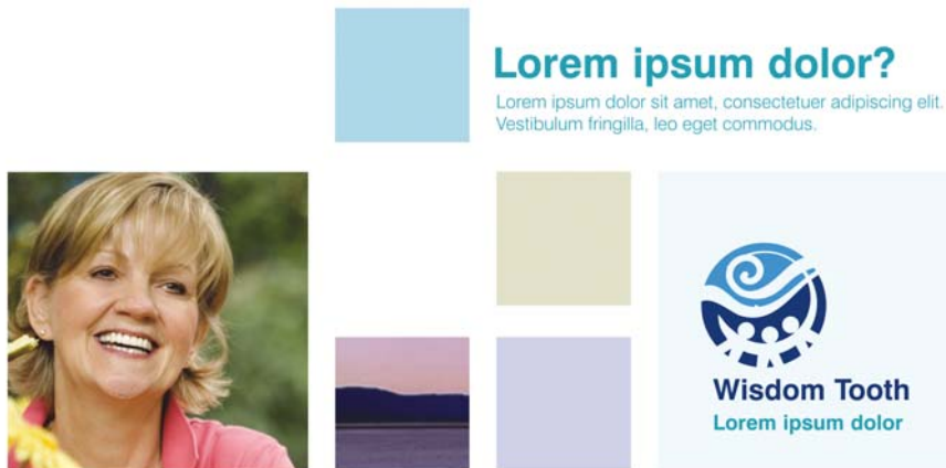
Abbildung 6: Dieses modulare Gitter ermöglicht eine schier unerschöpfliche Anzahl von Designmöglichkeiten. Wird es eingesetzt, bleibt der Aufbau der Seite mit daran ausgerichteten Objekten dennoch stets sauber und wohlstrukturiert.