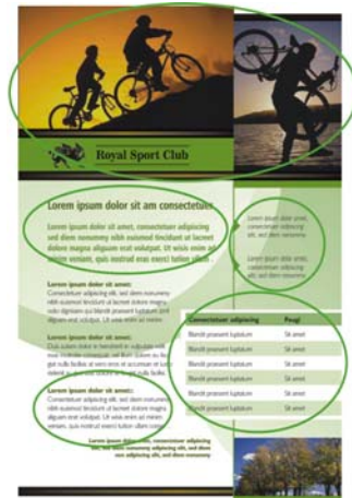
Abbildung 1: Beachten Sie, auf welche Weise Text und Fotos auf der Seite angeordnet sind. Durch die Nähe inhaltlich zusammengehöriger Elemente wird der Leser durch die Seite geführt.

Das Prinzip der Nähe besagt, das zusammengehörige Elemente auch optisch als zusammengehörig gekennzeichnet werden müssen, damit sie eine kohärente Einheit bilden