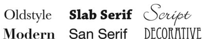
Abbildung 8: Sechs Kategorien von Schriften

Häufig werden Schriften danach kategorisiert, wie serifenreich sie sind (mit Serifen werden die Querstriche auf der oberen bzw. unteren Hauptlinie der einzelnen Buchstaben bezeichnet). Es sind zwar Tausende von Schriftarten verfügbar (deren Auflistung den Rahmen dieses Lernprogramms sprengen würde), die meisten dieser Schriftarten gehören jedoch zu einer von sechs übergeordneten Kategorien (Abbildung 8).