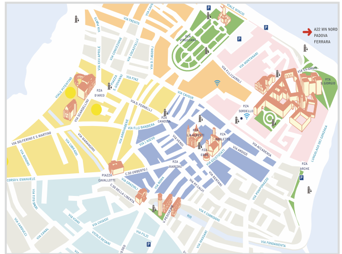
Dessiner une carte de Mantoue avec bâtiments, routes, places et quartiers en 3D, CorelDRAW Graphics Suite simplifie la tâche.

Sommaire : Depuis la fin des années 1980, gagné par sa polyvalence et sa compatibilité, deux éléments indispensables à cette coopérative d'impression qui fait partie du Gruppo L'Espresso, le Bureau des graphistes de CITEM utilise CorelDRAW ® pour créer des pages de publicité, des bannières et des graphismes.