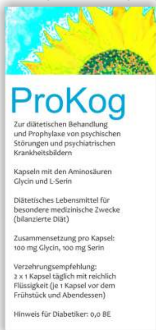
Mittel zur unterstützenden Behandlung von psychiatrischen Erkrankungen

Bei drei Apotheken, vierzig Mitarbeitern, einem Versanddienst und seiner eigenen Forschungstätigkeit als klinischer Pharmakologe fragt