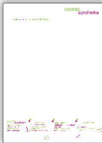
Briefpapier in neuer CI der Coerde-Apotheke in Münster