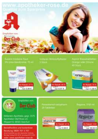
Coverseite des Kataloges der Versandapotheke im Herbst 2009