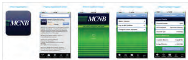
Le nuove app per iPhone e di mobile banking di MCNB Banks sono state disegnate da Identity America.

"Ultimamente, stiamo aiutando i nostri clienti a migliorare la propria identità aziendale utilizzando CorelDRAW. Vogliamo che siano orgogliosi della propria immagine" spiega Neal.