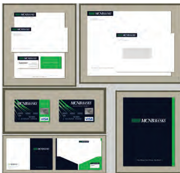
Tra i progetti professionali forniti a MCNB Banks da Identity America sono inclusi carta intestata, brochure, biglietti da visita, buste, bancomat e carte di credito e altro ancora.