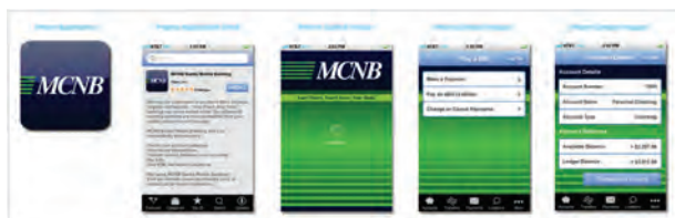
Les nouvelles applis bancaires pour iPhone et mobiles de MCNB Banks sont conçues par Identity America.