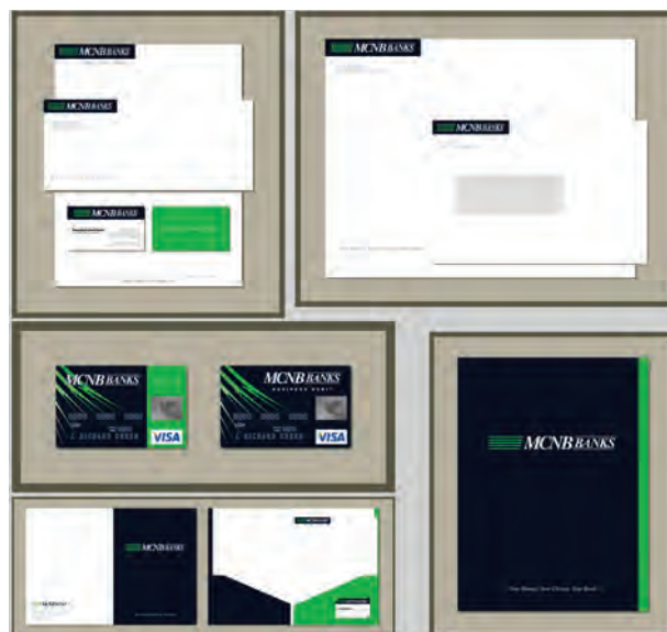
Designs pour en-tête, brochures, cartes de visite, enveloppes, cartes bancaires et cartes de crédit font partie de la collection de designs professionnels fournis à MCNB Banks par Identity America.