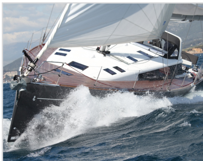
Bénéteau es el constructor de veleros líder mundial.