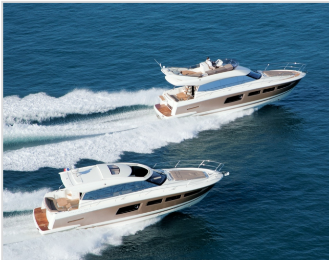
El yate Prestige 500 ha ganado ya varios premios.

En la actualidad, la empresa fundada por Bénéteau, que sigue llevando su nombre, está especializada en convertir en realidad los sueños de otros. Además de embarcaciones de pesca, la empresa diseña y construye veleros, lanchas motoras y yates de diversos tipos y tamaños. De hecho, Bénéteau se ha convertido en el constructor líder mundial de veleros (con unas 10.000 embarcaciones al año). En cualquiera de las regatas más importantes, participa siempre como mínimo un barco de Bénéteau, aunque lo normal es que haya varios.